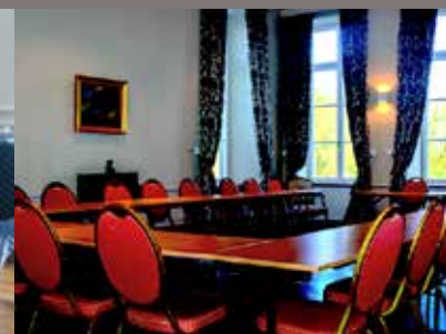
SALON DES 4 SAISONS