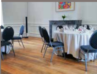
SALON DU PONT