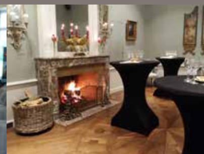
SALON DES ARTS