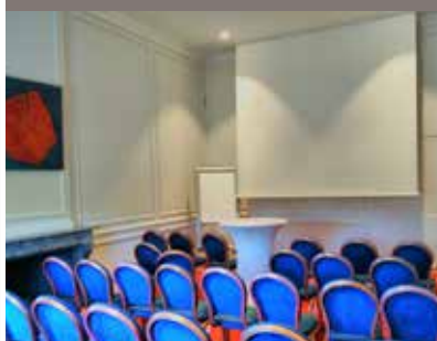
SALON COMTESSE DE NAMUR