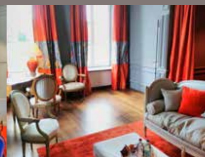
CHAMBRE DE L'EMPEREUR